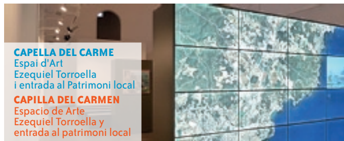
CAPELLA DEL CARME Espai d'Art Ezequiel Torroella i entrada al Patrimoni local