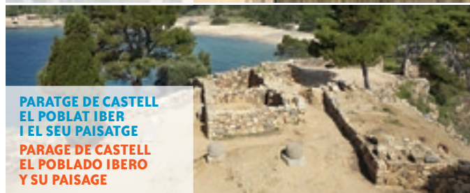
PARATGE DE CASTELL EL POBLAT IBER I EL SEU PAISATGE