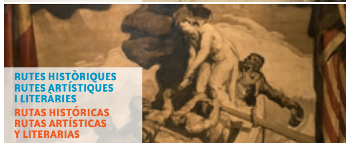
RUTES HISTÒRIQUES RUTES ARTÍSTIQUES I LITERÀRIES