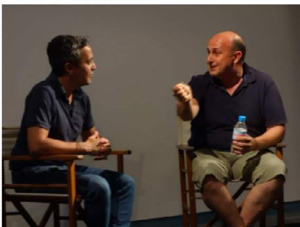
Un breu debat va posar el punt final a les projeccions del cicle de cinema documental d'enguany.

Del 5 al 7 de juliol, Palamós va participar a la 7a Mostra Internacional de Cinema Etnogràfic de Catalunya amb un cicle de cinema documental.