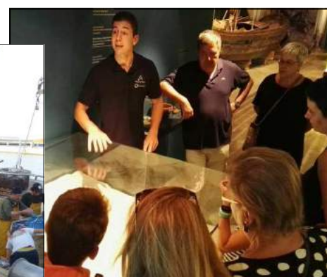
Visita guiada Gamba de Palamós