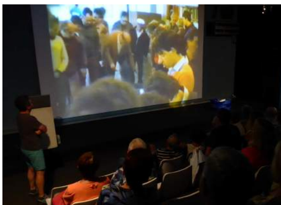
Els espectadors van poder veure vells enregistraments de la subhasta cantada a la llotja de Palamós.

rememorar els espais, les persones i les escenes que formaven part d'aquell món actiu, atractiu i singular, amb l'ajuda de peixateres, majoristes, subhastadors, pescadors i la resta d'assistents.