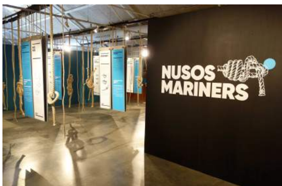
L'Exposició "Nusos mariners" posa a prova la perícia dels visitants.

L'exposició és una idea del Museu de la Pesca, amb museografia de Quim Esteve i disseny de Lupagrafics.