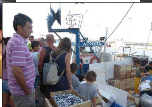
Visita guiada El peix blau