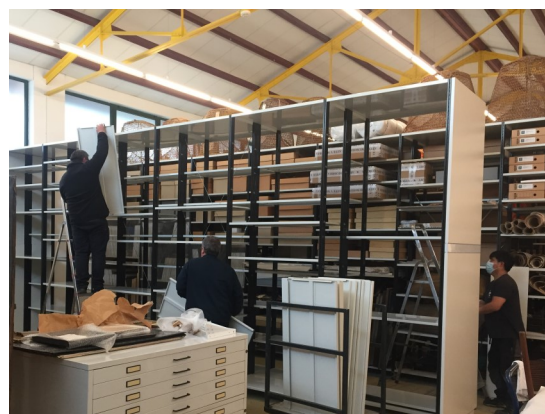
L'espai disponible ha permès afegir una prestatgeria de gran capacitat a la sala de reserva, a fi de millorar l'emmagatzematge de les peces del Museu.

Esperem poder continuar al llarg d'aquest any el procés de reorganització i reinstal·lació dels fons amb materials de conservació dut a terme l'any 2020 per tal de continuar garantint la preservació de les col·leccions patrimonials que es conserven a Casa Montaner.