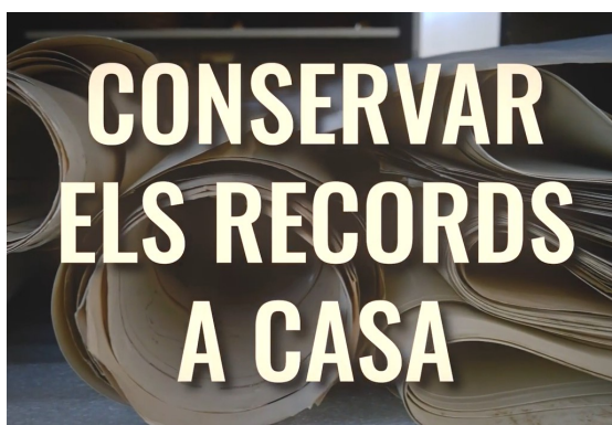
La situació sanitària ha propiciat la creació de nous recursos en format audiovisual per continuar la tasca de conservació, estudi i difusió del patrimoni marítim i pesquer.

Aquests enregistraments es podran veure al web del Museu i a les seves xarxes socials, i seran emesos per TVCB que els difondrà en divendres successius a partir del dia 26 de març després del seu informatiu del vespre.