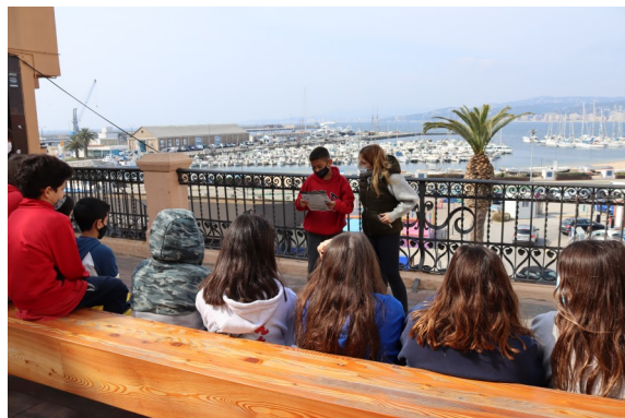
Els alumnes de 6è de l'escola La Vila durant la visita guiada "Viure entre muralles".

En col·laboració amb el Servei d'Arxiu Municipal i l'Àrea de Medi Ambient de l'Ajuntament de Palamós, el Museu de la Pesca ofereix visites per a conèixer el Palamós medieval, el pas del pirates per la Vila el 1543, el paisatge litoral municipal o els peixos desembarcats a la llotja palamosina.