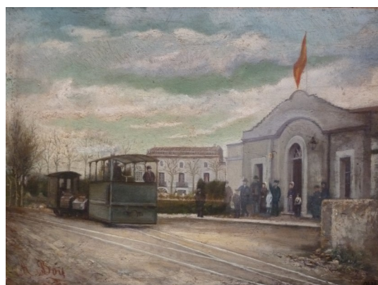
En aquesta secció recuperem un element del fons del Cau de la Costa Brava, precursor del Museu de la Pesca.

A la col·lecció del Museu hi trobem aquesta petita pintura sobre fusta realitzada per Agustí Boy i Deulofeu (1831-1891) que ens mostra el pas del tren petit per l'estació de la Bisbal. Es tracta d'un oli sobre fusta, amb número d'inventari 0434, i de dimensions 19,7 x 26,8 cm.