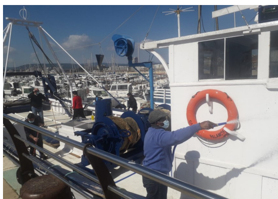
Durant el curs els participants han realitzat diverses pràctiques de pintura, fusteria i manteniment tant a bord d'embarcacions com al taller.