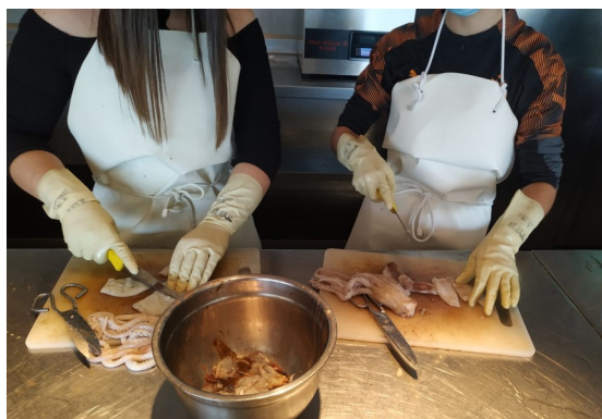
Al curs de peixateria els alumnes aprenen a reconèixer i a preparar el peix per a la seva venda.

Durant els mesos de gener, febrer i març s'han dut a terme diversos cursos de formació a l'Espai del Peix. El primer, d'aprenent de peixateria, d'11 de gener a 5 de febrer, amb una durada de 80 hores. El 21 de gener va començar el curs d'ajudant de cuina PFI-PTT Palamós-Palafrugell. Des del 22 de febrer, tingué lloc un altre curs d'ajudant de peixateria,