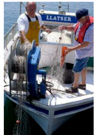
L'estiu passat vam iniciar la Pescaturisme a Palamós.