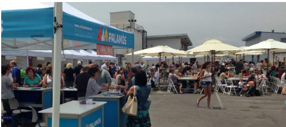
Per segon any la proposta d'una fira dedicada a la gamba de Palamós ha estat un èxit.