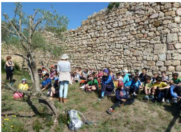
Un moment de la visita del grup al castell.

El passat 29 de març va tenir lloc l'acte d'inauguració del castell de Sant Esteve, situat sobre la platja de la Fosca, després d'un llarg procés de consolidació, tot donant el tret de sortida de les visites guiades a aquesta edificació emblemàtica per la creació i la història de la vila de Palamós. Des de llavors, les visites programades cada diumenge a les 12 del migdia, coordinades des del Museu de la Pesca i amb caràcter gratuït, han tingut una bona acceptació per part del públic