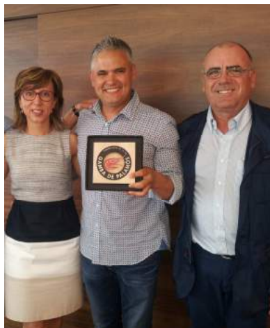
Nandu Jubany sosté el guardó.

El dia 12 de juny va tenir lloc a l'Espai del Peix el lliurament al reconegut xef català i estrella Michelin, Nandu Jubany, del guardó Ambaixador de la Gamba de Palamós, per la seva tasca en la difusió i promoció de les qualitats gastronòmiques d'aquest producte.