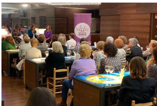
Una imatge de l'acte "Dones i economia blava a la Unió Europea", organitzada per la Universitat de Girona a l'Espai del Peix.

Els mesos de gener i febrer, l'Espai del Peix ha impartit el curs d'Especialista en Peix destinat a persones en situació d'atur. Organitzat per l'Ajuntament de Palamós pel Servei d'Ocupació de Catalunya, els participants han après tasques bàsiques de l'ofici de peixater i d'auxiliar de cuina. El mes de març, amb motiu del Dia Internacional de la Dona, l'Associació de Dones de Palamós va celebrar un acte per homenatjar cinc dones del sector sanitari. Va ser un acte con-