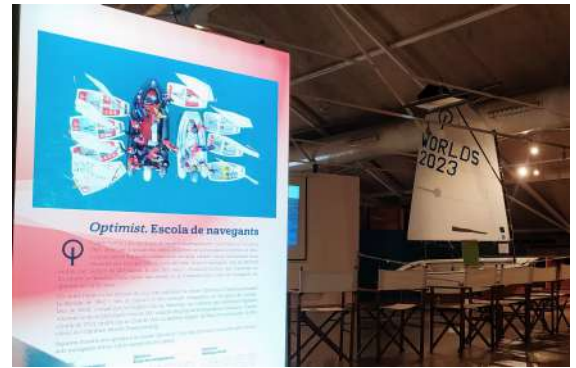
L'exposició "Optimist, escola de navegants" va coincidir amb la regata internacional Vila de Palamós Optimist Trophy.

Aquesta exposició va coincidir amb la regata internacional Vila de Palamós Optimist Trophy que cada any omple la badia de Palamós amb aquests petits vaixells, enguany amb més de 500 vaixells inscrits.