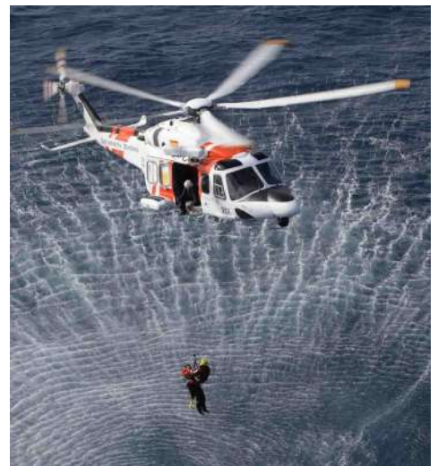
Un helicòpter de Salvamento Marítimo formarà part de l'exhibició de rescat a mar.

A més a més, hi trobareu esports nàutics, jocs i tallers per a la mainada, gastronomia marinera, visites al museu, embarcacions tradicionals... i un munt d'activitats per a petits i grans. Us hi esperem!