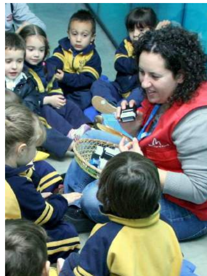
Un grup de nens escolten la monitora durant l'activitat.

Totes les activitats tenen una durada aproximada de 75 minuts i sempre són guiades o acompanyades per un educador especialitzat.