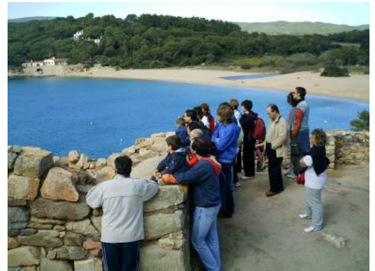
Vista guiada al poblat iber de Castell.

Aquesta tardor també estarà en marxa el programa d'activitats entorn al patrimoni immaterial Memòria Viva, amb Converses de Taverna , Mestres dels Fogons i Imatges que fan Parlar i la novetat del cicle de cinema documental etnològic , que s'emmarca en la Mostra de Cinema Etnogràfic de Catalunya promoguda per la Direcció General de Cultura Popular, Associacionisme i Acció Cultural de la Generalitat de Catalu-