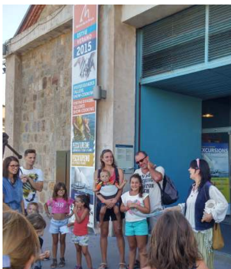
Inici de la visita guiada del corsari Barba-roja, adreçada a tota la família.