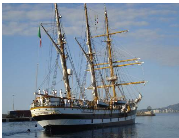
El vaixell Palinuro sortint del port de Palamós.