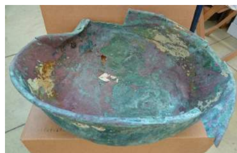
Ribella amb núm. inventari 03789 trobada al fons del mar i que serà restaurada.

els moments i els llocs. Per a la mostra s'han seleccionat vora un centenar de peces dels fons dels museus de la Xarxa, i s'ha encarregat la restauració d'aquelles que ho requerien. Del Museu de la Pesca s'ha considerat necessari el tractament de vuit peces vinculades a la conserva del peix i al fet de menjar a bord per tal que llueixin en aquesta mostra que es podrà veure els mesos de novembre i desembre a Palamós i que durant dos anys viatjarà pels altres museus de la xarxa.