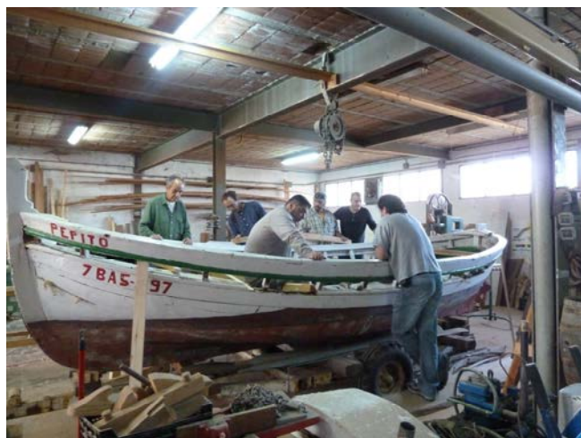
Alumnes de la passada edició del curs de restauració d'embarcacions de fusta

Degut a la veda de la flota d'arrossegament durant les 5 primeres setmanes de l'any, no s'ofereix la visita guiada a la subhasta, per la reducció horària de la mateixa. La resta d'activitats com show-cookings i tallers de cuina es continuaran realitzant amb el peix que prové de la flota d'encerclament i dels armelladers.