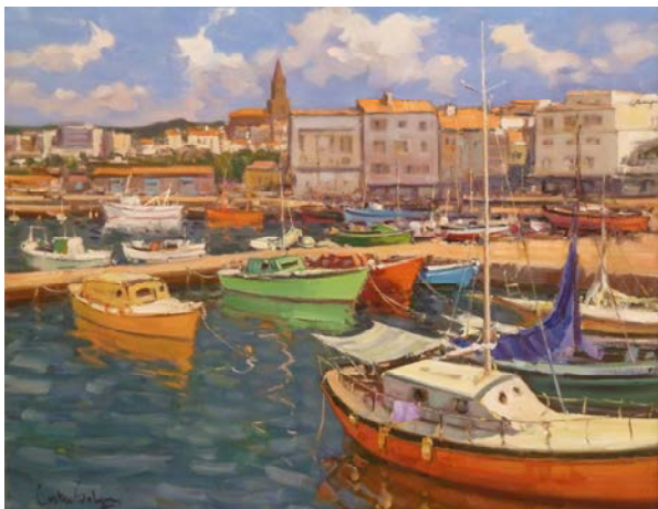
Des del club nàutic. Oli sobre tela

Costa Sobrepera ha estat el guanyador de la convocatòria 2014 d'exposicions artístiques temporals del Museu de la Pesca. La mostra estarà oberta al públic del 12 de desembre de 2014 fins a l'1 de febrer de 2015. L'entrada és lliure i els horaris són els d'obertura del Museu de la Pesca.