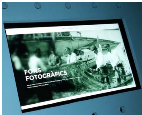
Pantalla digital de consulta dels fons documentals

de la comunitat pesquera de la Costa Brava. A més, s'ha afegit informació d'interès, com ara una aplicació per conèixer la pesca a Catalunya en totes les seves dimensions, accés a l'interactiu dels peixos del Museu de la Pesca, o l'espai expositiu que es manté en línia sobre la Gamba de Palamós. L'interactiu inclou també un joc adreçat als visitants, un repte de preguntes i respostes que posa a prova els coneixements sobre els peixos, la pesca i l'exposició permanent del propi museu.