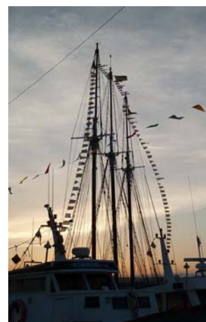
Una imatge de Palamós Terra de Mar, 2014

taverna i el programa pedagògic Viu la Mar rep la màxima afluència d'usuaris: centres escolars de l'educació infantil, primària i secundària que a través del Museu de la Pesca, l'Espai del Peix i les barques del peix, amb tallers i visites guiades volen aprofundir en la cultura marinera del nostre territori. Per acabar, els dies 9 i 10 de maig torna el festival mariner Palamós, Terra de Mar , que aquest any posarà el seu focus en el món de la vela, i oferirà un gran ventall d'activitats pensades també per al públic familiar.