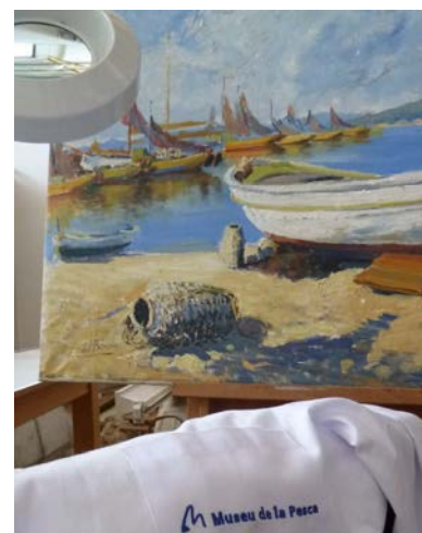
La pintura durant el procés de restauració

cant tensions i deformacions; estrips; claus oxidats; esquerdes i pèrdues de capa pictòrica. El procés de restauració ha suposat primer retirar el bastidor vell, i la neteja i aplanat de les bandes per preparar-les per al seu reentelat. Aquest s'ha dut a terme amb teixit de polièster i adhesiu Beva Film. Amb les bandes reforçades, hem pogut col·locar i fixar la pintura al nou bastidor. Tot seguit s'ha realitzat la reintegració de les llacunes amb estuc, i una vegada anivellades, s'han retocat amb pigments en pols i vernís de retoc.