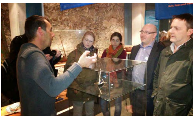
Un moment de la visita del grup del projecte Gap 2 al Museu de la Pesca