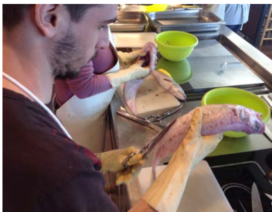
Un alumne del curs de peixateria impulsat pel Consell Comarcal del Baix Empordà

El 2015 s'ha iniciat a l'Espai del Peix amb diferents cursos vinculats a àmbits de la restauració, la cuina i el peix. Així, aquest equipament treballa i es consolida en un dels seus principals objectius, com és esdevenir escenari per a l'ensenyament i la capacitat de professionals en l'àmbit de la cuina del peix i del producte pesquer. Concretament aquest primer trimestre s'inicien els cursos de peixateria, impulsat pel Consell Comarcal del Baix Empordà i Dipsalut; de curs de cambrer, organitzat pel SOC i l'Ajuntament