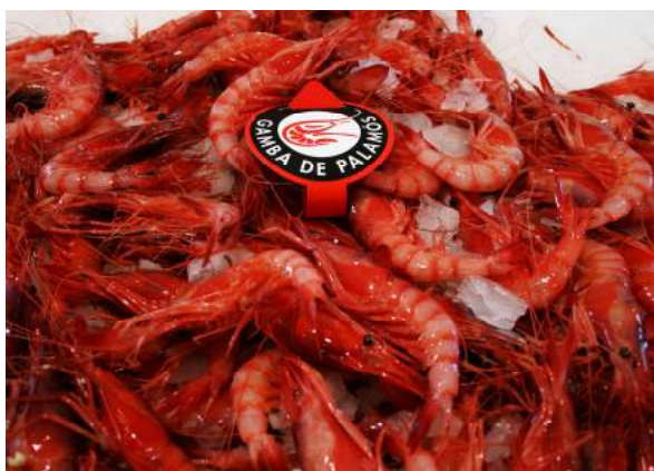
Pescadors, científics, administració i agents del territori treballen plegats per assolir una pesca sostenible i responsable de gamba vermella.