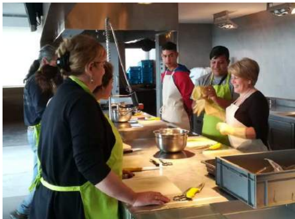
Alumnes del curs d'ajudant de cuina que s'ha dut a terme a l'Espai del Peix.

Aquesta primavera l'Espai del Peix ha dedicat molts esforços a la formació i la divulgació. Hem desenvolupat un curs d'ajudant de peixateria i un d'ajudant de cuina amb l'Àrea de Promoció Econòmica de l'Ajuntament de Palamós dins el projecte de Pla de barris. També amb el Servei de Ciutadania i Immigració de l'Ajuntament hem repetit amb molt d'èxit l'activitat Les cuines del món , on vilatans procedents d'altres països ens els expliquen a través dels plats i dels gustos.