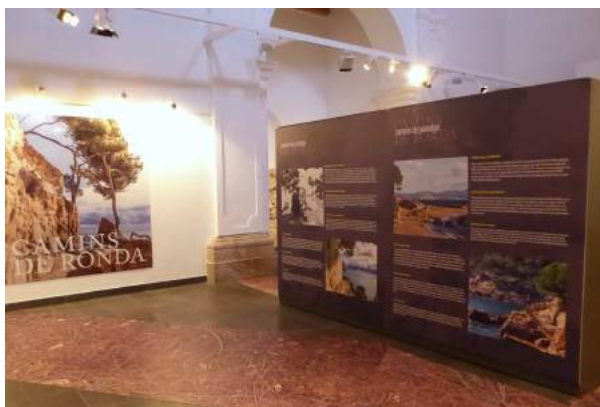
Un detall de l'exposició "Camins de ronda", aquest estiu a la capella del Carme.

Del 22 de juny al 2 de setembre la capella del Carme ha acollit l'exposició Camins de ronda , que ha estat visitada per 2.293 persones.