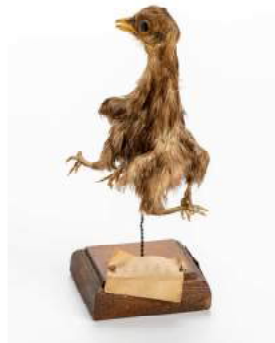
Poll doble, amb número d'inventari cm01754.

Els nens que visitaven el museu El Cau quedaven impressionats per la varietat d'objectes que s'hi exposaven. Eren uns altres temps, i el món sense Internet era menys global. Les sales amb espases i objectes exòtics o la sala amb vitrines amb petxines i cargols feien les delícies dels més petits, tot i la imparable decadència d'aquella institució que va tancar les seves portes l'any 1989.