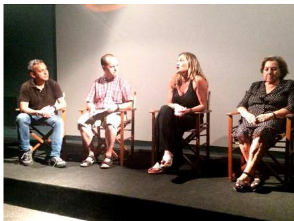
Els protagonistes en un moment del debat posterior a la projecció del documental La Carmeta i el moll.

El 16 de juliol vam inaugurar el cicle "Mar Fràgil", dins el programa de la 8a Mostra Internacional de Cinema Etnogràfic . Durant tres dies es projectaren tres audiovisuals relacionats amb el patrimoni històric i etnològic del territori i del sector pesquer, d'abans i d'ara, per interpretar els canvis d'hàbits, l'impacte tecnològic en les activitats quotidianes, la desaparició d'oficis emblemàtics, la transformació del paisatge, les infraestructures, les tradicions... Totes les projeccions van continuar amb