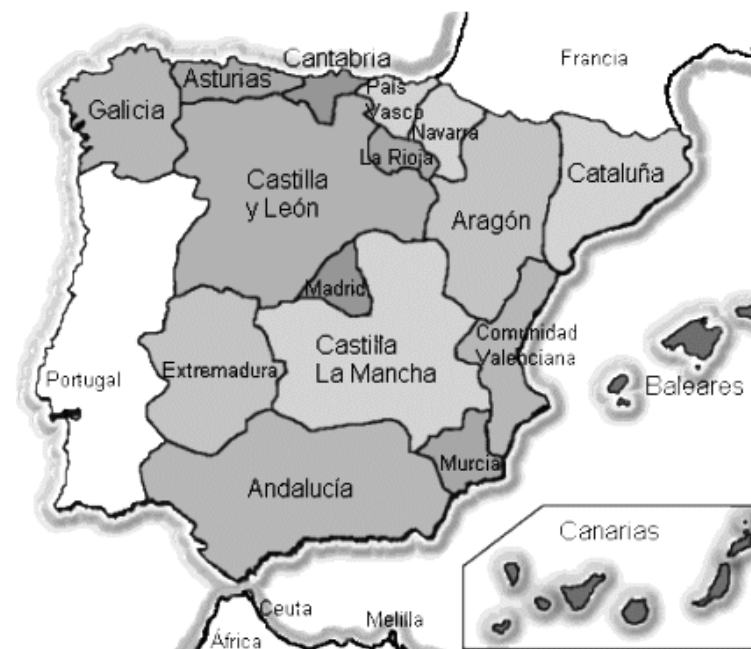
Figura 1. Regiones (CCAA) en el Estado español

En el Noreste de España, Cataluña es una de las regiones con exclusividad en la gestión de las pesquerías costeras. El sistema de TURF es un componente básico de su esquema de gestión. Nos detendremos en analizar este caso particular caso por dos razones: la disponibilidad de datos y porque es una CCAA sin pesquerías de larga distancia, donde prácticamente todas sus pesquerías se desarrollan en su área costera vi .